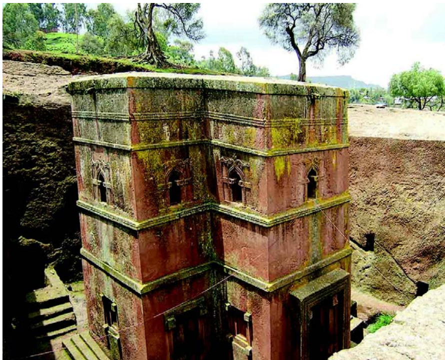
拉里贝拉岩石教堂

埃塞俄比亚居民中45%信奉埃塞俄比亚正教（即东正教），40-45%信奉伊斯兰教，5%信奉新教，其余信奉原始宗教。