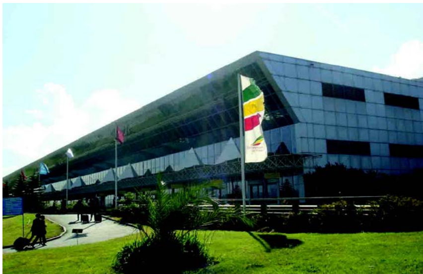
亚的斯博莱国际机场

埃塞俄比亚的航空业发展迅速，全国共有40多个机场，其中亚的斯亚贝巴、迪雷达瓦和巴赫达尔为国际机场。亚的斯亚贝巴巴宝利国际机场是东部非洲的空运中心，多年被评为“非洲最佳机场”，向15家航空公司提供地勤服务。埃塞俄比亚航空公司有60余架飞机，国际航线70多条，国内航线30多条，安全系数、管理水平和经济效益均佳。