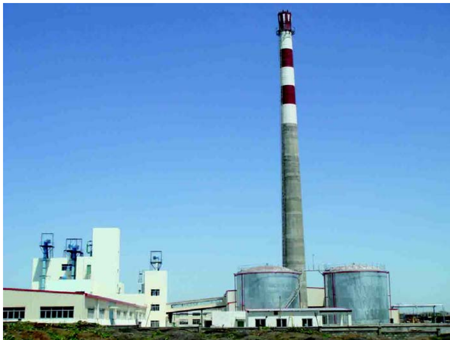
中非基金1号投资项目中地海外埃塞俄比亚汉盛国际玻璃有限公司生产主线

建设集团、葛洲坝集团、中国中铁股份公司、中地海外有限公司、中兴、华为、北方国际公司和中国土木工程公司等。2012年，签约项目中铁路项目有较大进展，新能源项目成为新的亮点。